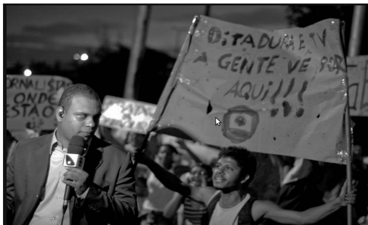
Imagem 5: #protestoemvitoria.