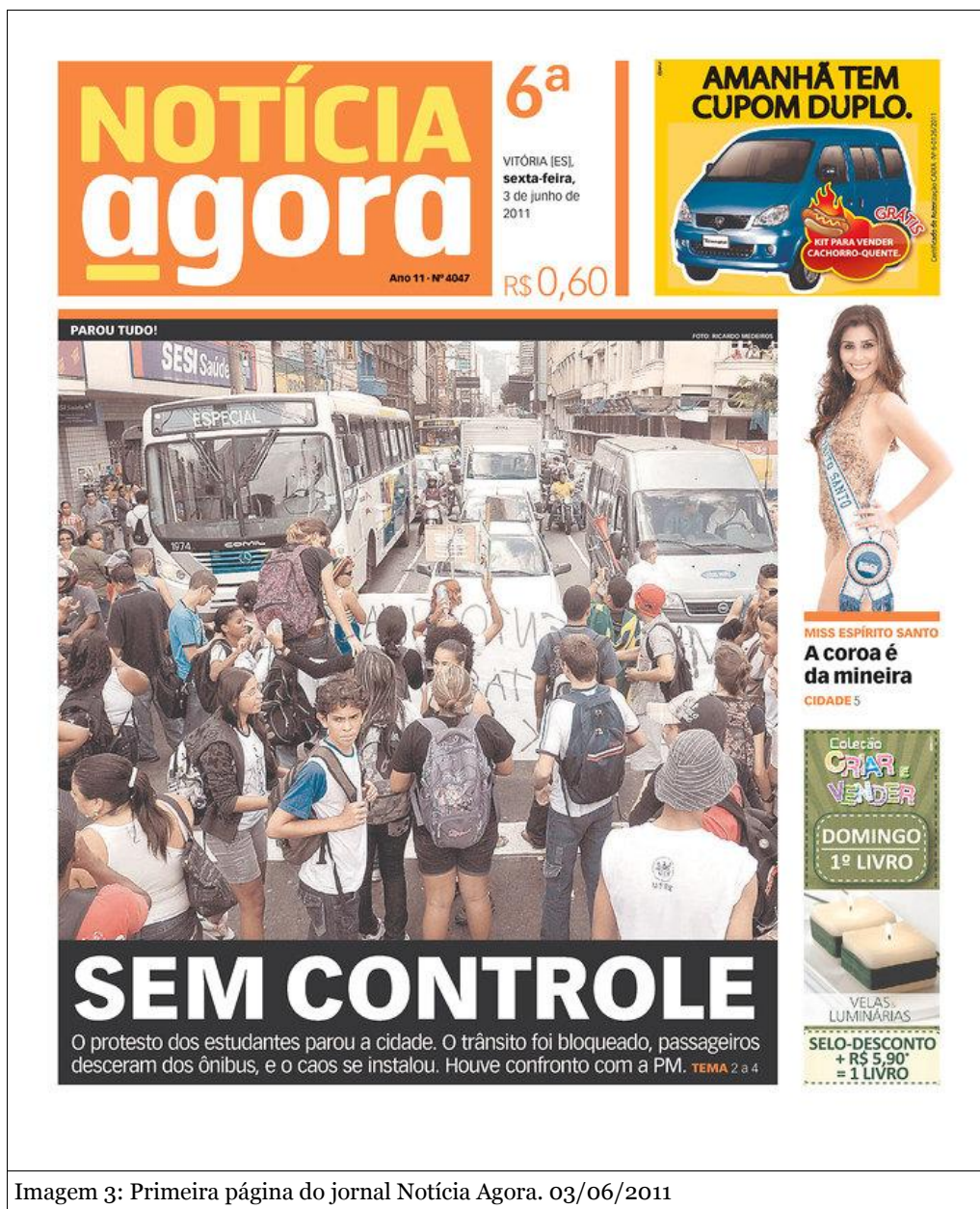
Imagem 3: Primeira página do jornal Notícia Agora. 03/06/2011

O relato resumido do ocorrido é apenas ilustrativo e serve de contextualização para o leitor. O que importa verdadeiramente é o pano de fundo desse evento. Como uma manifestação de pequenas proporções, organizado sem uma liderança e sem apoio das mídias tradicionais, constituído basicamente de estudantes secundaristas, conseguiu mobilizar toda a cidade para o tema do transporte público? Ou como afirma Malini (2011) em bom texto sobre o evento: