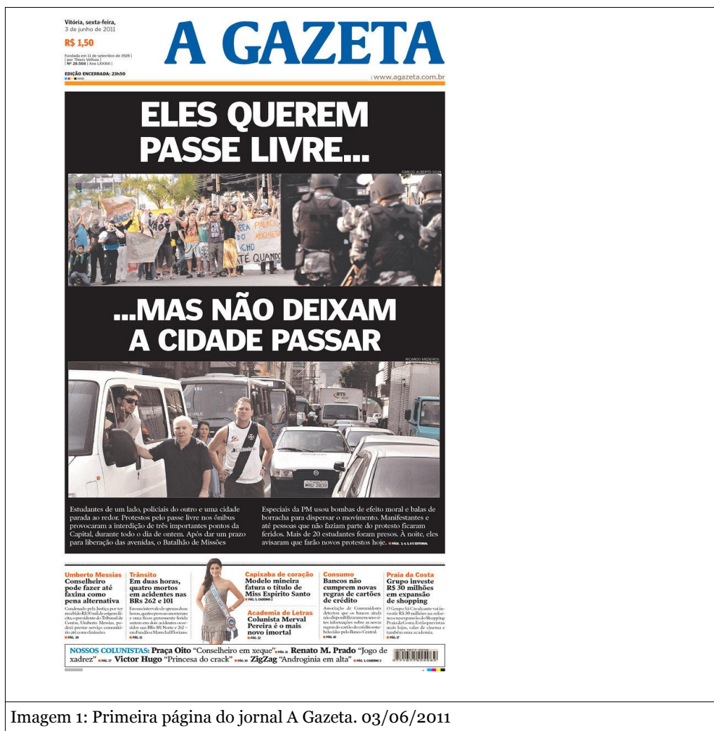
Imagem 1: Primeira página do jornal A Gazeta. 03/06/2011

de grande movimentação. Enquanto nas redes o tema era abordado de modo múltiplo e recheado de histórias, o jornalismo tradicional da cidade optou por uma posição oficialista, rotulando as manifestações de “baderna” (imagens 1, 2 e 3) e praticamente desconsiderando a atitude truculenta da polícia. O poder estava usando a mídia tradicional para conter o movimento que, naquela altura, questionava o próprio governo do Estado. Mas o tiro saiu pela culatra e ao fim do dia mais de 5 mil pessoas tomaram as ruas, a polícia bateu em retirada, e os manifestantes alcançaram a Terceira Ponte, completando o percurso que havia sido evitado na noite anterior. Diante da repercussão negativa de seu posicionamento, as principais redes de comunicação tiveram que recuar, passaram a cobrar do Estado punição para os excessos policiais e colocaram em debate a questão da mobilidade urbana em Vitória, tema que apareceu na pauta de reivindicações do movimento.